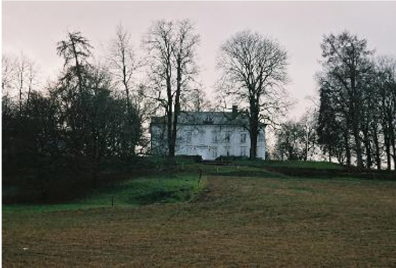
Torps herrgård 2006